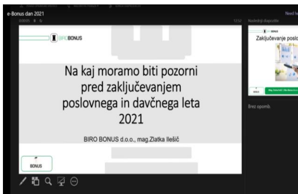
Slika 5: Insert iz predstavitve