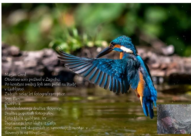
Slika 6: Predstavitve fotografa

Hkrati smo na šoli odprli tudi fotografsko razstavo njegovih del na hodniku šole, ki so si jo študentje z zanimanjem ogledali. Razstava bo na voljo za ogled še ves mesec.