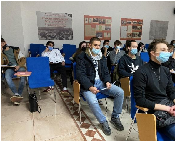
Slika 2: Študenti