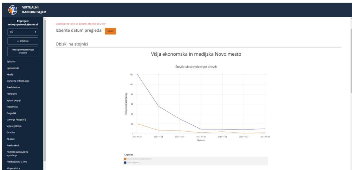
Slika 9: Zaslonski posnetek analitike obiska sejma v času od 22. 11 – 28. 11.

Analiza obiska pokaže, da se je našega virtualnega razstavnega prostora udeležilo 244 obiskovalcev, ki so jih najbolj zanimali izobraževalni programi, splošna predstavitev šole, gradiva in osnovne informacije. Večina teh obiskovalcev je prostor samo preletela, 42 obiskovalcev pa si jih je razstavni prostor pogledalo zelo natančno. Na sliki je vidna dinamika obiskov v obdobju odprtega sejma.