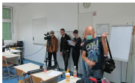
Slika 3: Priprava na snemanje