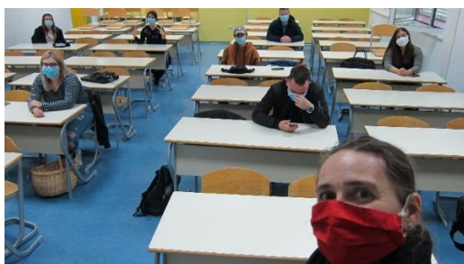
Slika 2: Pouk PDVP v post-koronskem obdobju

Lekcija »korona krize« nas je vse le še bolj povezala.